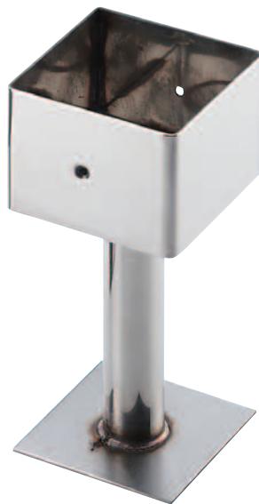
カップ型(釘タイプ)100角