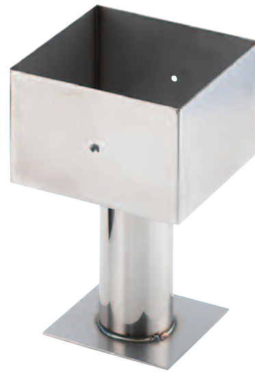
カップ型(釘タイプ)150角